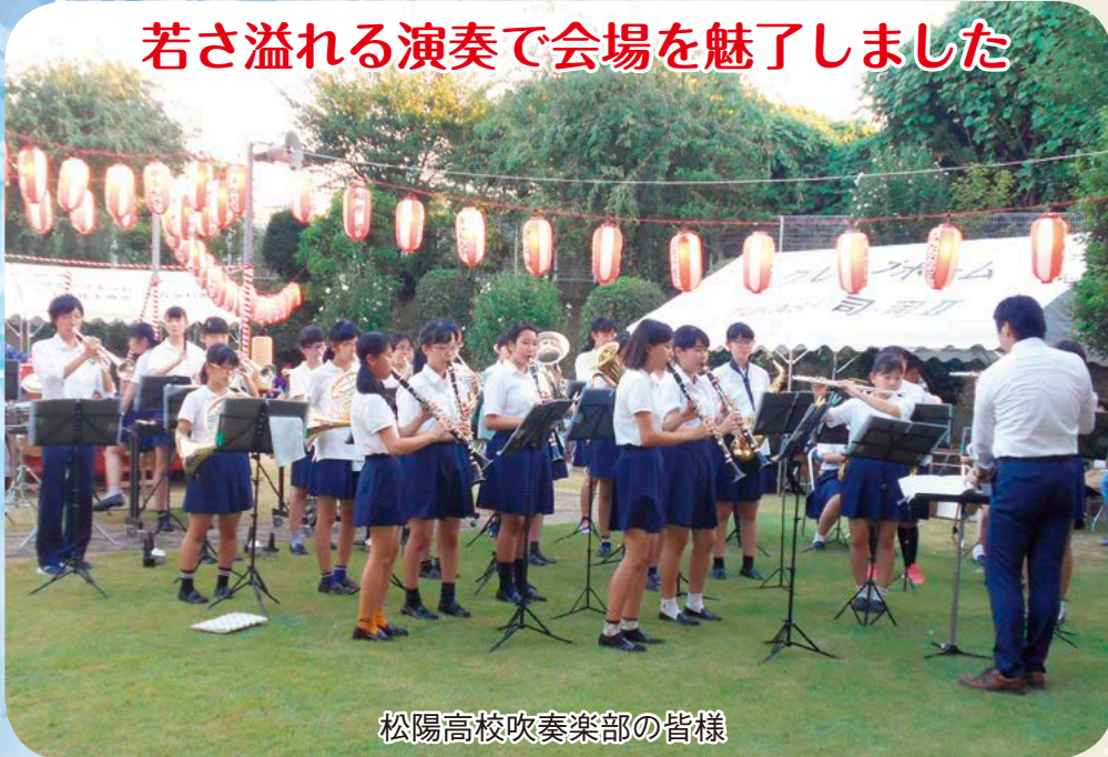
松陽高校吹奏楽部の皆様