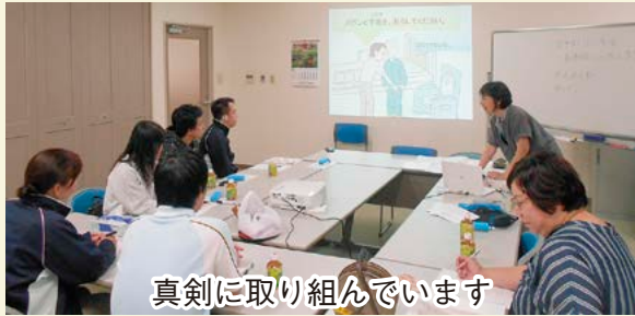
真剣に取り組んでいます