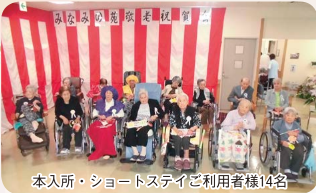
本入所・ショートステイご利用者様14名