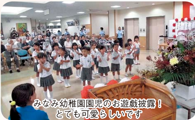
みなみ幼稚園園児のお遊戯披露！ とても可愛らしいです