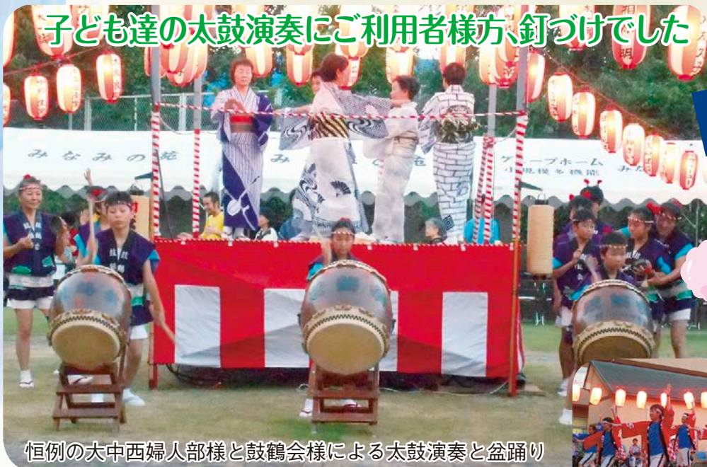
恒例の大中西婦人部様と鼓鶴会様による太鼓演奏と盆踊り