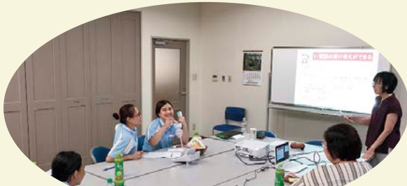
電話対応の練習をしました