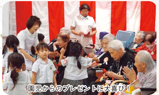
園児からのプレゼントに大喜び！