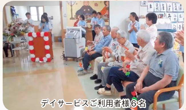
デイサービスご利用者様6名