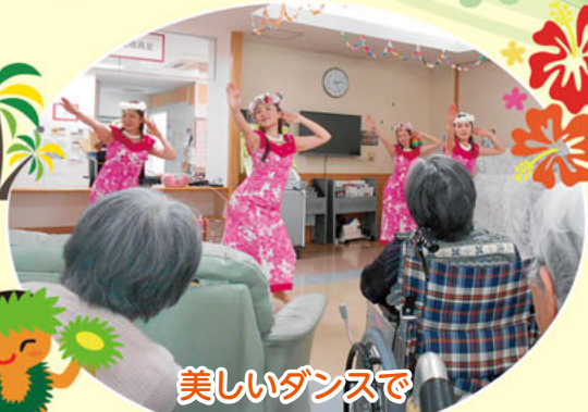
美しいダンスで ご利用者様を魅了しました。