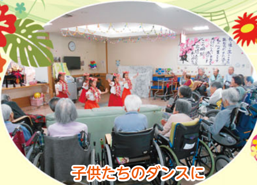
子供たちのダンスに 皆さん「かわいい！」と大絶賛。