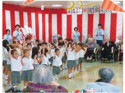
みなみ幼稚園の園児さんが かわいいダンスを披露してくれました。