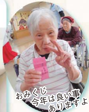
おみくじ 今年が良い事 ありますよ!