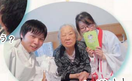
今年の年賀状もプレゼント!