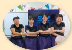
衣装はワーカー手作り! 踊りも一生懸命練習しました。