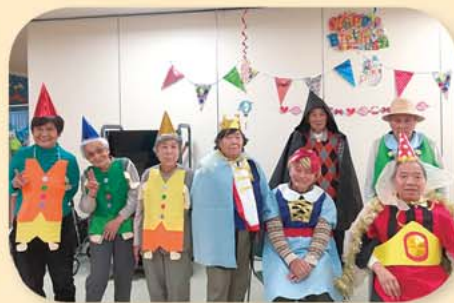
白雪姫の劇を行いました。