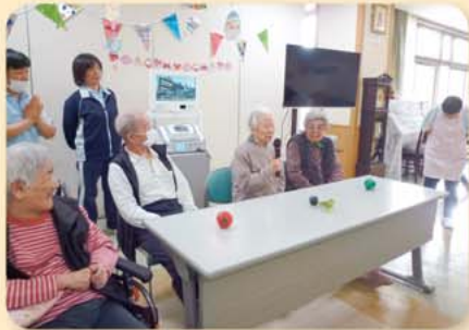
ご長寿クイズ 5問ずつ早押しです!