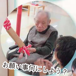
お願い事何にしよう?