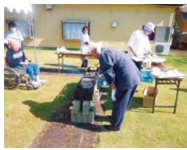
秋刀魚のほかに、椎茸やさつま芋も焼きました。