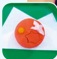
▲ご長寿を願って鶴と亀をモチーフにした和菓子です。