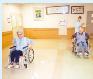
車椅子リレーやパン喰い競争を行いました。大きな声で応援し、とても盛り上がりました。