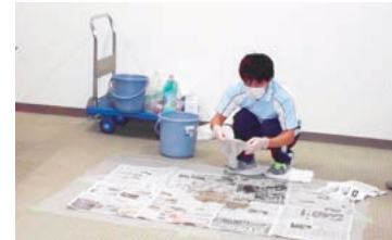
嘔吐物の処理を実践