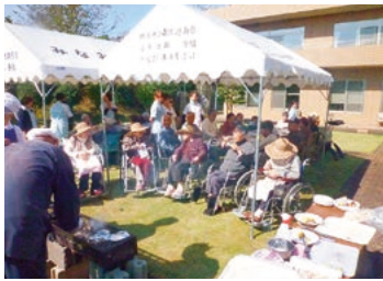
今年で4度目の恒例行事になりました。

当日は晴天に恵まれて、炭火焼の煙の匂いと骨なし尾頭付きの秋刀魚の食べやすさが大好評でした。